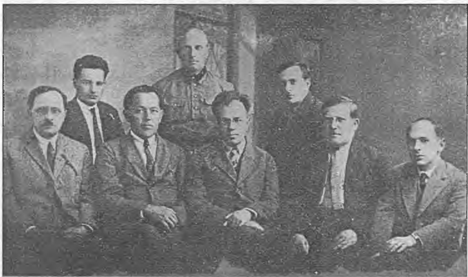
Праўленне БДУ, 1927 г.